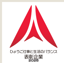
ひょうご仕事と生活のバランス 表彰企業 2025