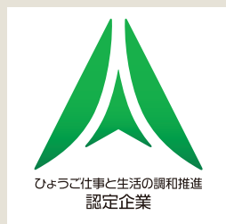
ひょうご仕事と生活の調和推進 認定企業