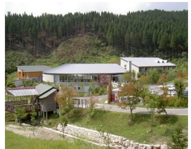
フォレストステーション波賀