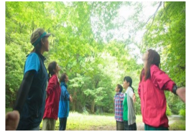
森林セラピー体験