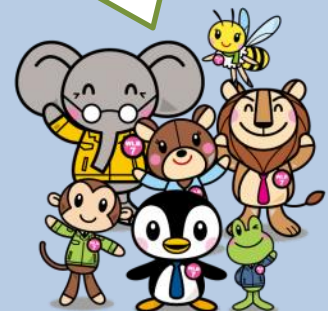
ひょうご仕事と生活センター キャラクター「WLB7」