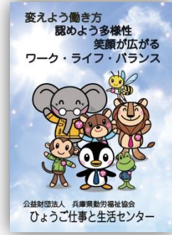
昨年度のポスター