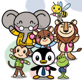
WLB7 ひょうご仕事と生活センターキャラクター