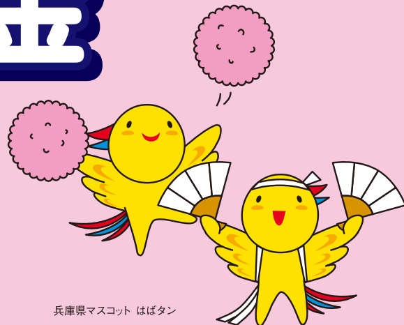
兵庫県マスコット はばたん

ひょうご仕事と生活センターでは、育児や介護などの理由で仕事を辞めざるを得なかった方が元の職場で再び継続的なキャリアアップができる働き方を促進し、「仕事と生活のバランス」の実現を目指すことを目的として、助成金を支給しています。